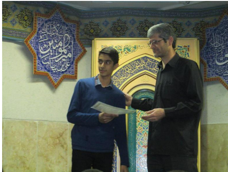
مراسم تنفیذ حکم رئیس جمهور