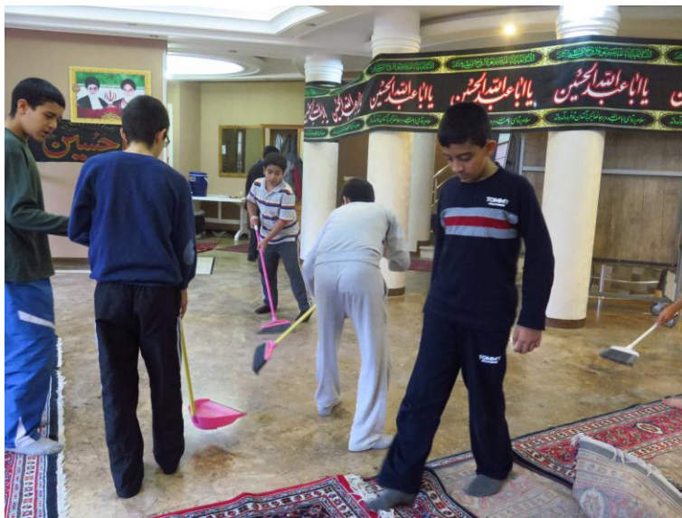
نظافت آخر اردو