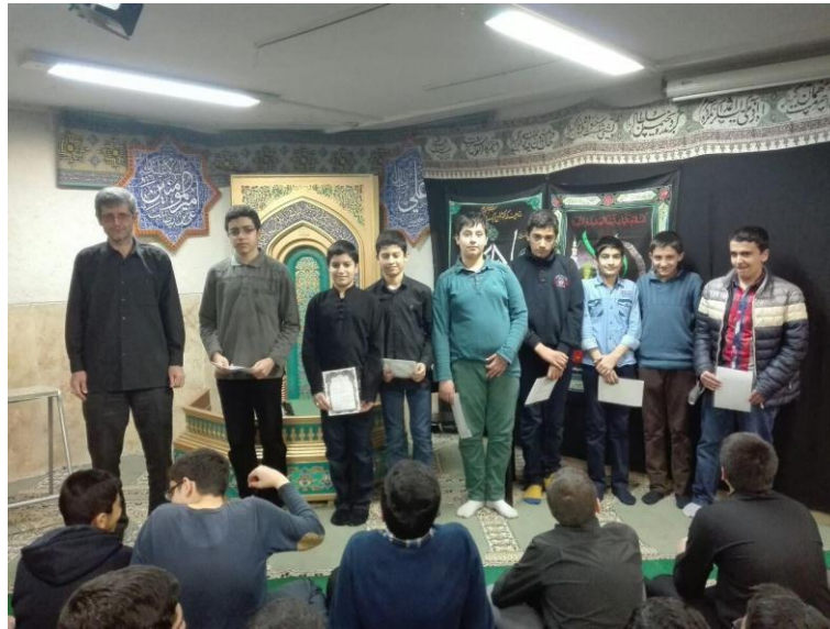
مراسم اعطای احکام شورای نگهبان

عدم قانون پذیری دانش آموزان یکی از مشکلاتی است که جامعه آموزش و پرورش با آن مواجه است. یکی از مهمترین علت های عدم تبعیت دانش آموزان از قانون، این است که ایشان از علت قانون گذاری اطلاعی ندارند و تصور می کنند قوانین برای باز دارندگی دانش آموزان از فعالیتهای متفاوت وضع شده است. بچه ها احساس میکنند مسئولین مدرسه با تنظیم قوانین مختلف قصد دارند تا دانش آموزان را در همه ابعاد محدود کنند. به همین علت عموماً از تبعیت و اجرای قوانین سرباز می زنند.