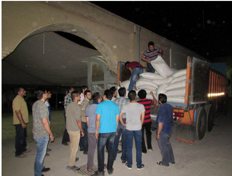
تخلیه‌ی بار ۱۵ تنی برنج، سه شنبه ۱۸ خرداد ۹۵، ساعت یک بامداد

همچنین برنامه‌ی دیگرگروه‌ها برگزاری اردوهای جهادی در تابستان هر سال می‌باشد که علاوه بر خدمات عمرانی و فرهنگی که در مناطق محروم داشته‌اند برای خود بچه‌ها خاطرات شیرینی به همراه دارد به طوری که بعد از فارغ التحصیلی از مدرسه باز داوطلب شرکت در اردو می‌باشند.