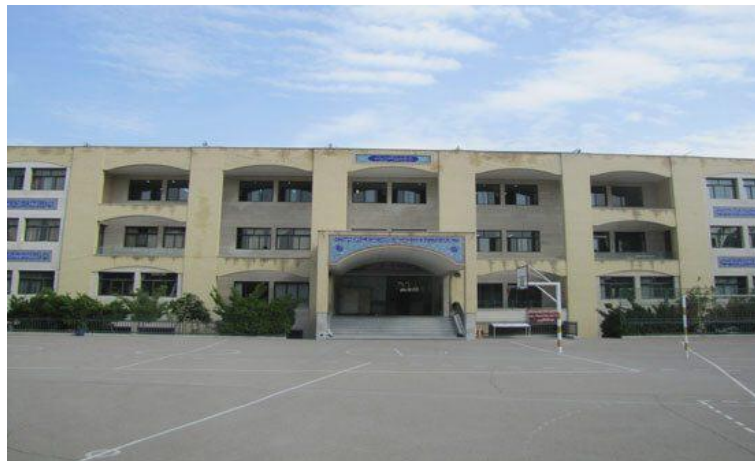
دبیرستان سادات دوره دوم

به همین ترتیب دبیرستان نیز در سال ۷۷ افتتاح و اولین دوره دانش‌آموزان در سال ۸۱ وارد دانشگاه شدند و تا امروز حدود ۱۴۰۰ دانش‌آموز از این مجتمع فارغ‌التحصیل و برای ادامه تحصیل به دانشگاه راه یافته‌اند.